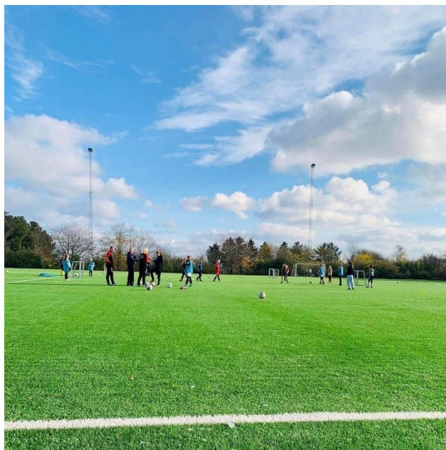
Fælles pigetræning med U16 Ø-pigerne i Nexø

I 2023 vil det store nationale pigeprojekt 'Get Movin' se dagens lys på Bornholm. Forhåbentlig skulle det gerne give mere fokus rundt om i klubberne på alt, hvad pige/kvinde fodbolden kan, og hvor vi skal hen sammen på Bornholm med pige/-kvindefodbolden.